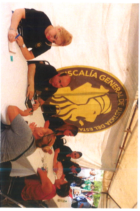
Los servicios del Poder Judicial fueron gratuitos para los ciudadanos de Juárez, y los tuvieron en sus colonias.

En los próximos meses volverá esta brigada para seguir apoyando, asesorando y beneficiando a más colonias, para que todas las